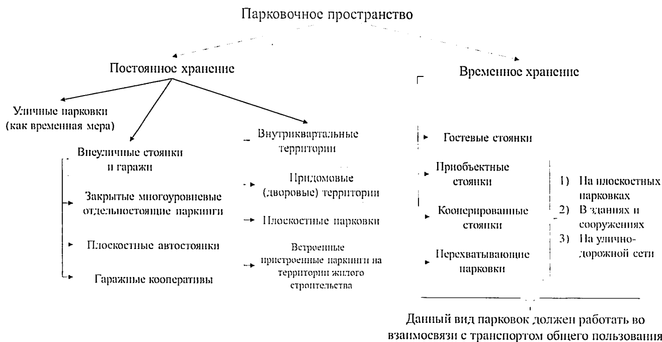
Рисунок 3. Структура элементов парковочного пространства

2.8. Рекомендуемая структура элементов парковочного пространства с учетом режима стоянки представлена на рисунке 3.