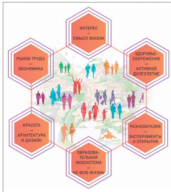
Иллюстрация 3. Факторы влияния на оценку качества жизненного пространства. Автор А. Н. Береговских

Наряду с обязательностью введения принципов устойчивого развития в систему архитектурно-пространствен-